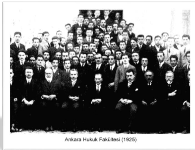
5 Kasım 1925 - İlk Hukuk Okulu Ankara Hukuk Mektebi

Ankara Üniversitesi Hukuk Fakültesi, tarihsel onurlu görevinin bilinci ile bu amaca 83 yıldır katkıda bulunmaktadır. Temel görevi hukukçu yetiştirmek, hukukun çeşitli alanlarında araştırmaları yönetmek ve desteklemek olan Hukuk Fakültesinde 110 akademik personel ile öğrenci işleri, kütüphane ve diğer yardımcı hizmetlerde görevli 45 idari ve teknik personel görev yapmaktadır.